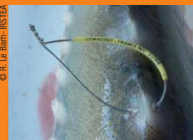
Marque externe à laisser sur le poisson capturé