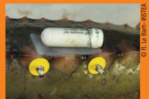
Balise à détacher du poisson capturé

Merci pour votre vigilance et votre contribution