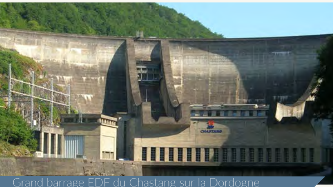
Grand barrage EDF du Chastang sur la Dordogne

Les premières causes de régression des populations sont la fragmentation des cours d'eau , l'artificialisation et la dégradation des habitats, avec une accélération au long du XX e siècle. Les barrages, seuils de toute nature, de plus en plus nombreux sur les cours d'eau , notamment les grands ouvrages