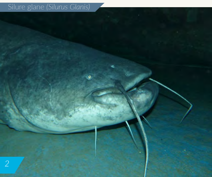
Silure glane ( Silurus Glanis )

hydroélectriques infranchissables édifiés à partir de la fin du XIX e siècle, ont réduit l'accès aux zones de grossissement des jeunes anguilles. Il faut y ajouter la disparition progressive des zones humides (prairies, marais, lagunes littorales) liée à l'urbanisation et à la modifications des pratiques agricoles.