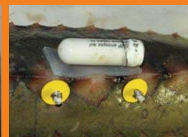
Balise à détacher du poisson capturé

Merci pour votre vigilance et votre contribution