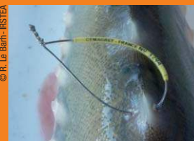
Marque externe à laisser sur le poisson capturé