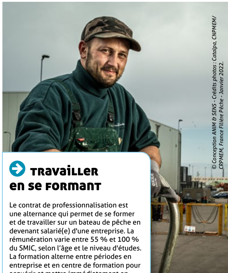
© Conception ANIM & SENS - Crédits photos : Catalpa, CNPMEM/CRPMEM, France Filière Pêche - Janvier 2022.

Brevet de chef mécanicien 8000 kW : naviguer en qualité de chef mécanicien, second mécanicien ou officier mécanicien sur tout type de navires dont la puissance propulsive est inférieure à 8000 kW.